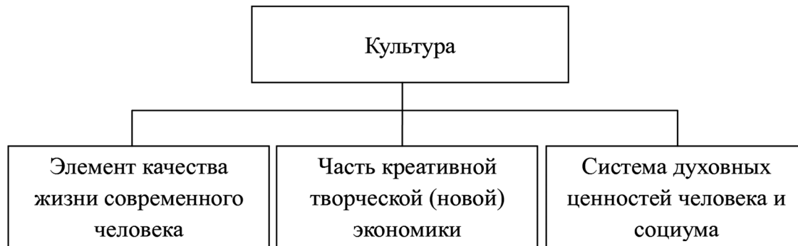
Рис. 3. Культура как современная сфера человеческой деятельности

Каждое из обозначенных выше направлений может быть предметом деятельности того или иного субъекта государственного и муниципального управления.