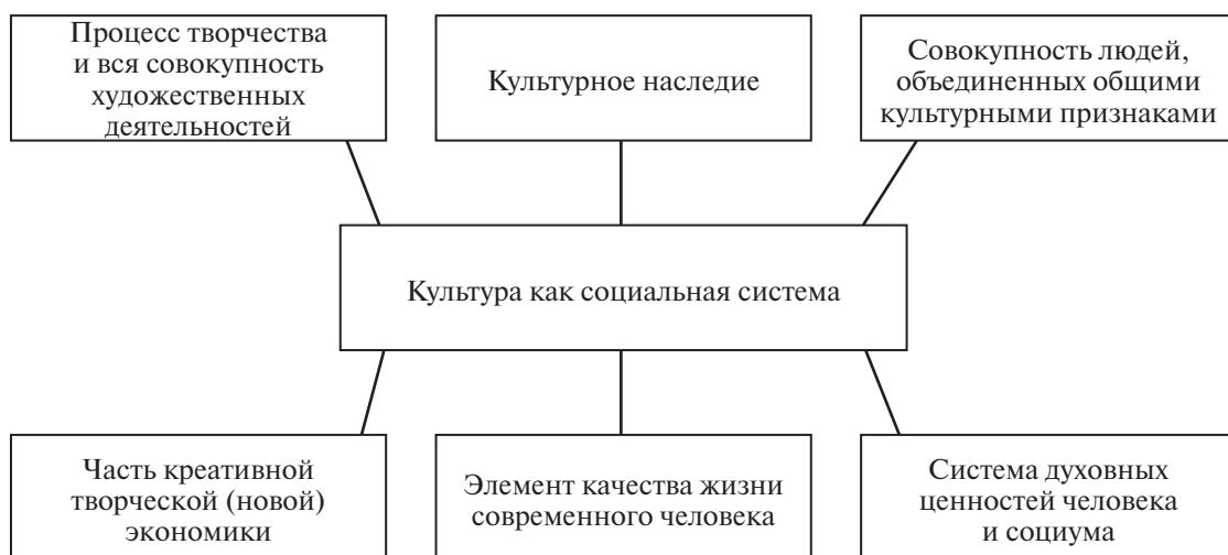
Рис. 1. Культура как социальная система

Изменить экономику, сделать ее новой, инновационной, творческой, креативной нельзя